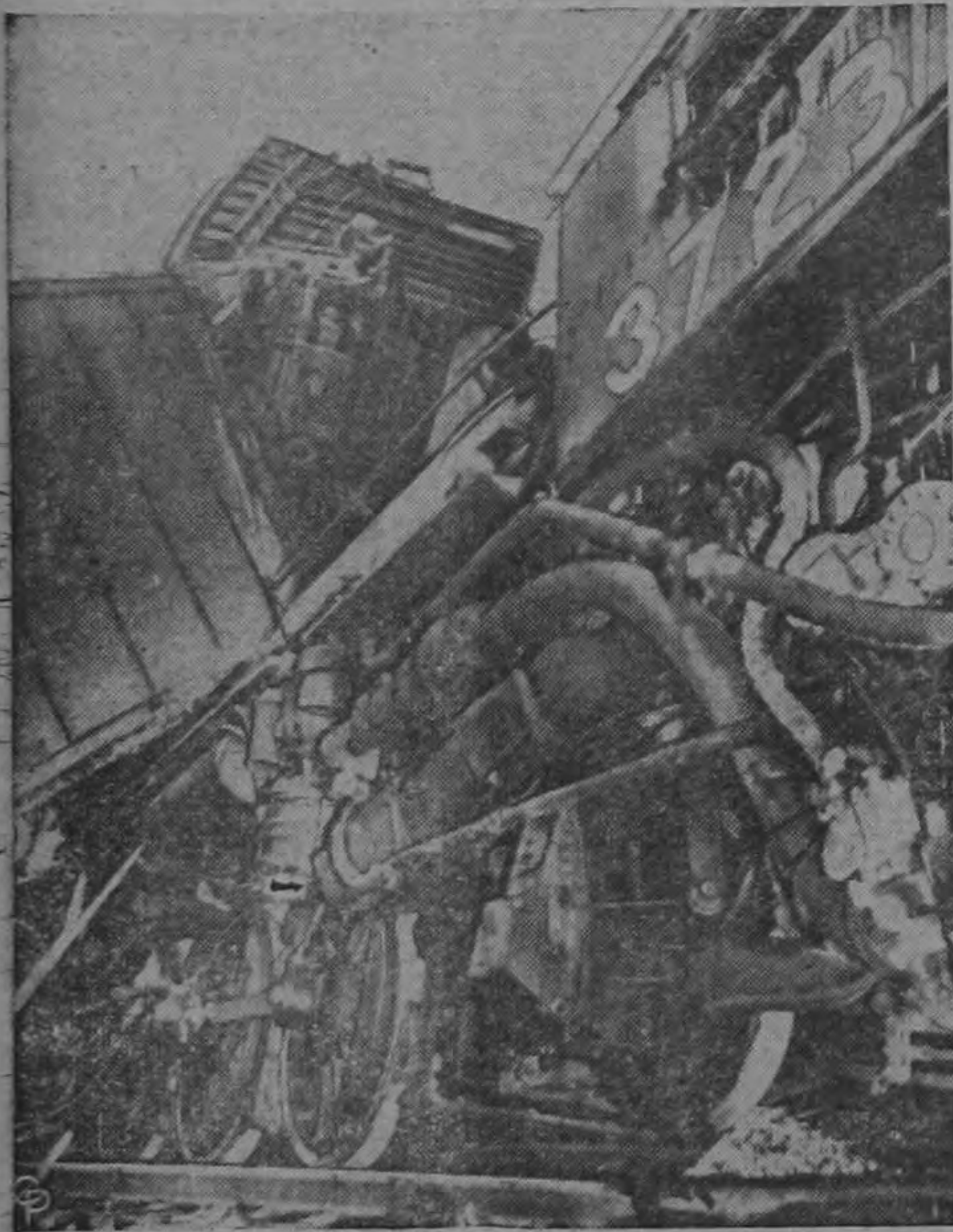
Aquí vemos los destrozos provocados por un choque de trenes de carga del Grand Trunk and Western Railroad en Fenton, Michigan, en el cual seis ferroviarios resultaron heridos. Dieciocho vagones se desrielaron y quedó destrozado como un kilómetro de vía.