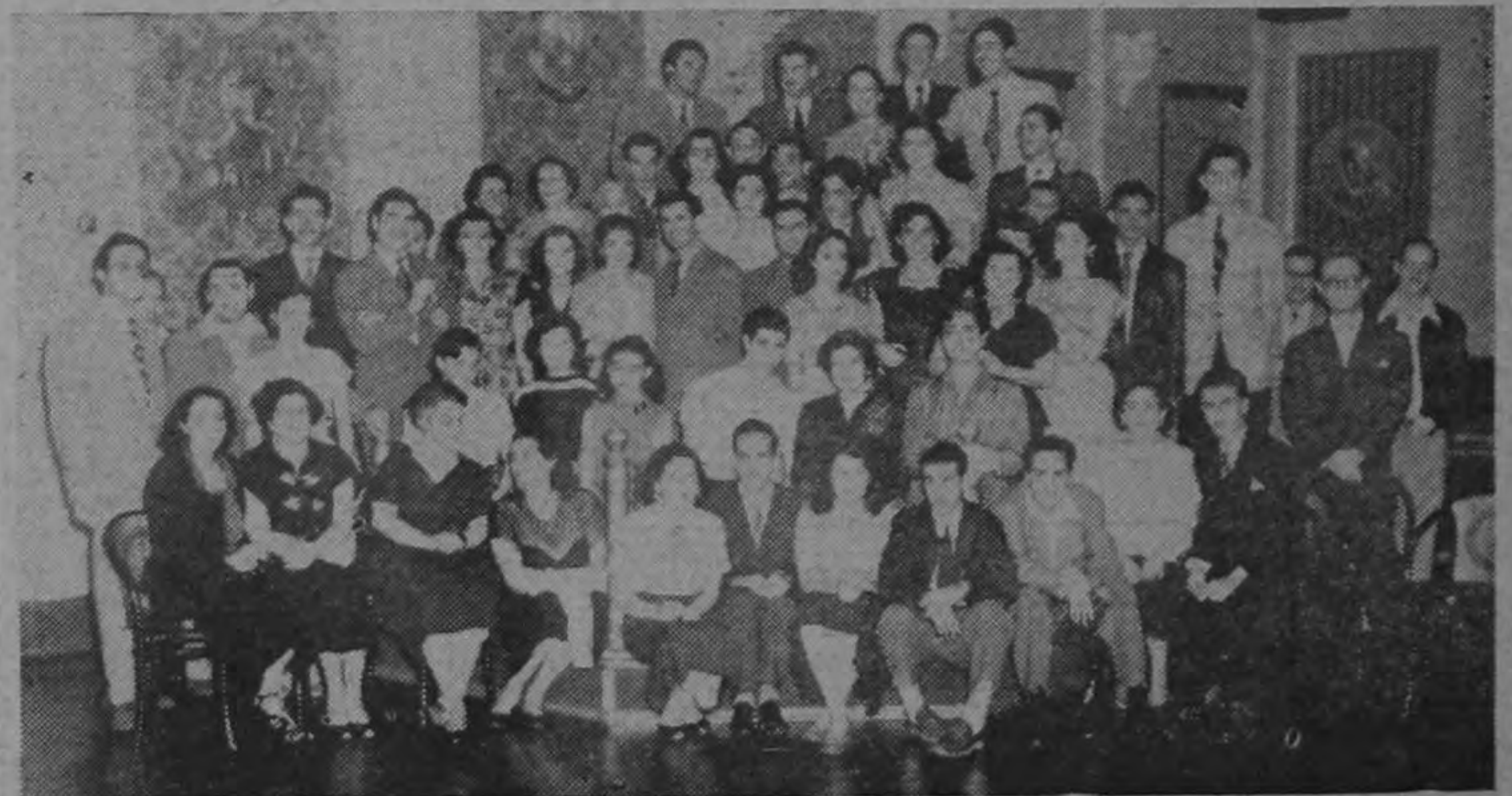
Grupo de socios del Club Tri Sigma durante una de sus reuniones habituales, mediante las cuales, la activa institución promueve, con el mejor de los éxitos, el estrechamiento de los vínculos sociales entre la juventud.

Pronóstico del Tiempo para el día 18 de julio Temperatura: Máxima 27°C. Mínima 16°C. Cielo: Nublados con claros. Estado del Tiempo: Carácter general, buen tiempo, con posibles chubascos aislados. Vientos: Débiles a moderados del E. S. E. Variables al NW. por el N. Zona del Pronóstico: Territorio de Costa Rica.