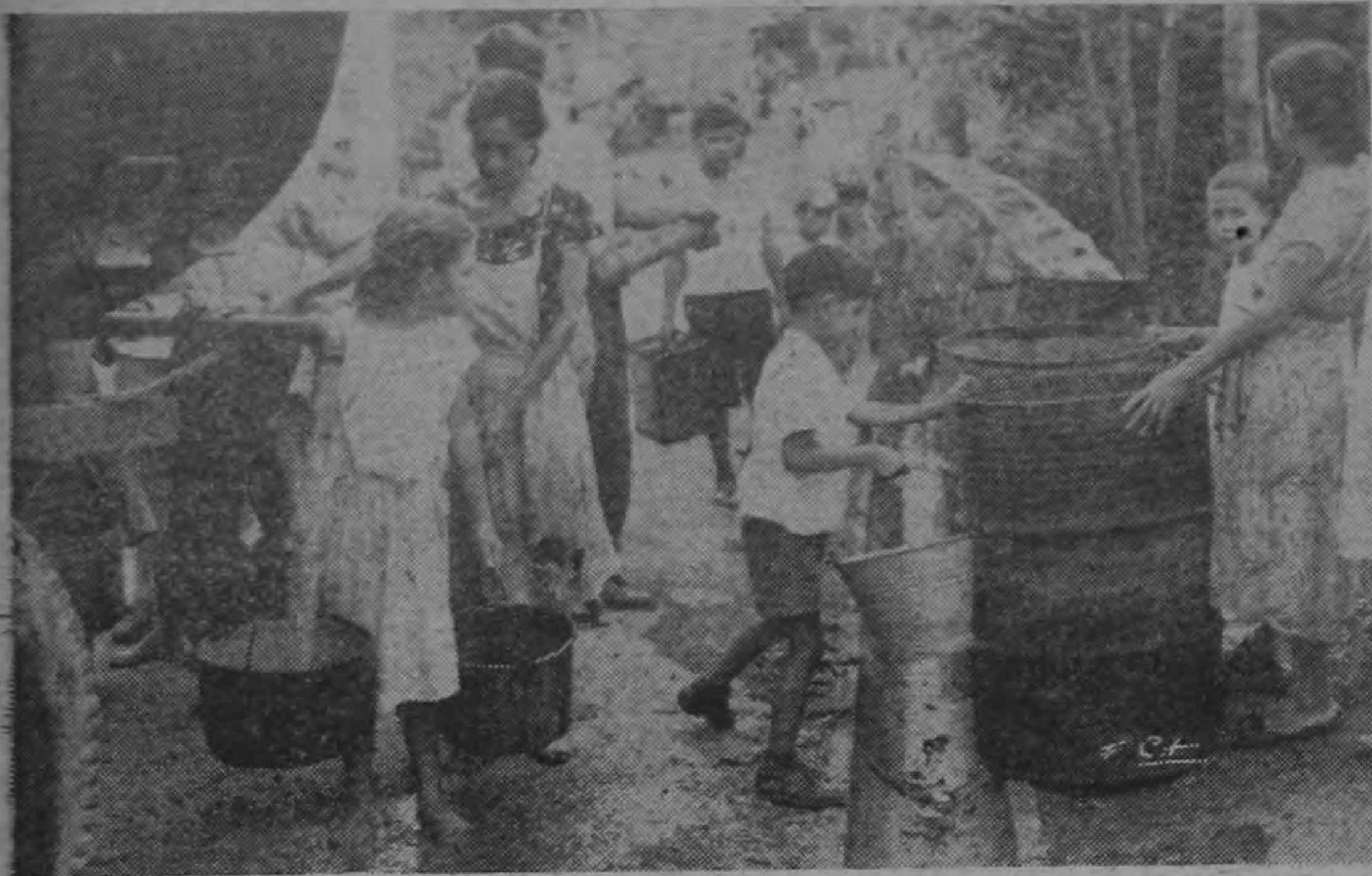
En todo su dramatismo está aquí reflejada la triste situación en que viven los moradores de los barrios del sur. La excursión en busca de agua es la preocupación constante. En tales condiciones no es posible hablar de higiene ni civilización. Este cuadro ha de estar presente en el pensamiento de los señores representantes cuando resuelvan sobre la distribución del impuesto municipal.